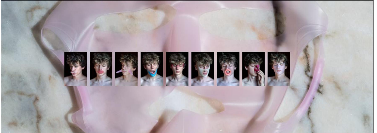
Krystyna Dul, „Forever Young“ Foto-Installation, 2023