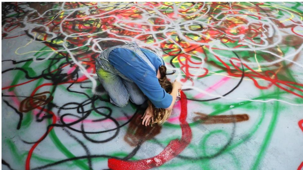
Paulette Penje, „Funny Isolations“, Video-Installation 2021/2023