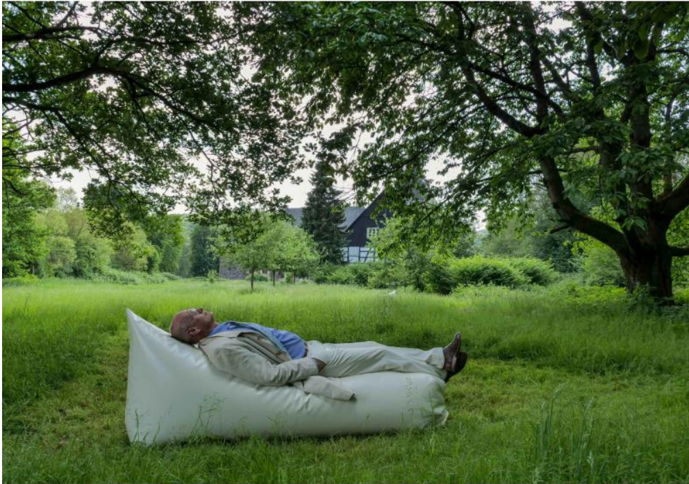
Frauke Eckhardt, „translocation_link“, Sound-Installation 2022