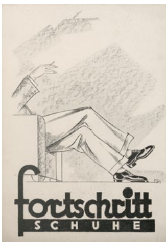
Figuren: © Wolfgang Knapp – Büro KulturGut Mannheim